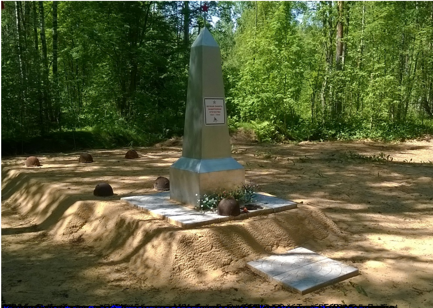
Кировский район. Ленобласть. Место захоронения воинов с Кировского района. Фото и